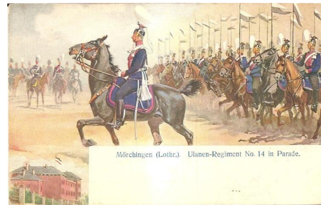
Parade du régiment des Uhlans