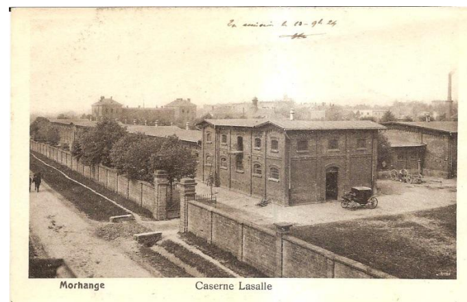
Baptisée « Caserne Lasalle » par les français après 1918