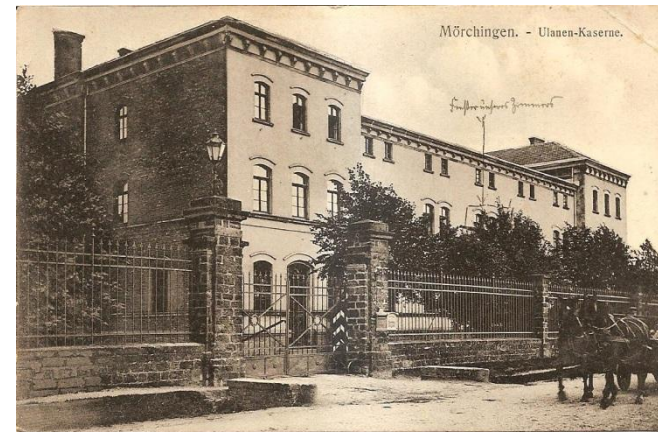
Entrée de la Caserne Route de Morhange