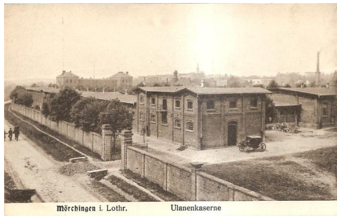
Caserne des Uhlans pendant la période de l'annexion